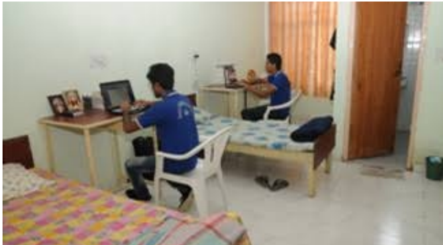
اس تصویر میں آپ نے کیا دیکھا؟ مختصر بیان کریں۔